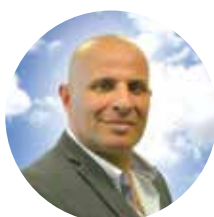
חובב צברי ראש המועצה המקומית קרית עקרון