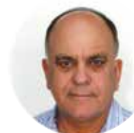
אלי אסקוזידו סגן יו"ר האשכול וראש המועצה האזורית נחל שורק